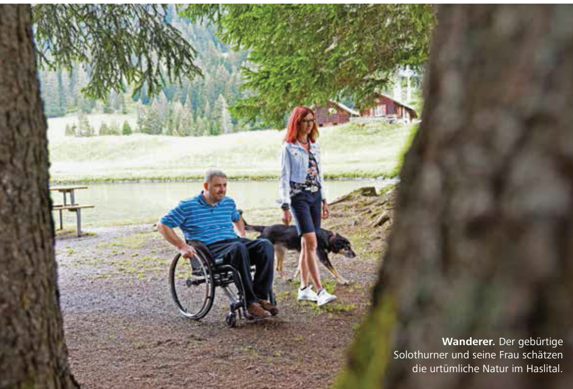
Wanderer. Der gebürtige Solothurner und seine Frau schätzen die urtümliche Natur im Haslital.